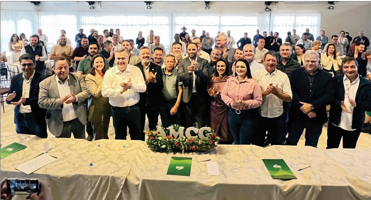
Prefeitos das cidades dos Campos Gerais se reuniram nessa quarta-feira (14), em Telêmaco Borba, com secretários do Governo de Estado

Diretor: Eloir Rodrigues • Ponta Grossa, Quinta-Feira, 15 de Maio de 2025 • www.jornaldamanha.info • Ano 71 • Nº 21.796 • R$ 7,00